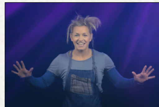
L'ABC de l'accrobatie