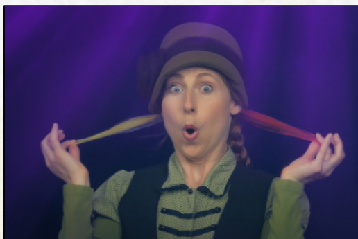
L'ABC de la jonglerie I

https://zone.laubergine.qc.ca/zone-famille/tutoriels/labc-du-personnage/